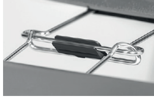
block for alignment links blocco agganci