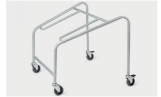
trolley (max 20 pcs) carrello