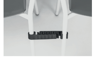
black polypropylene alignment links agganci allineamento in polipropilene nero