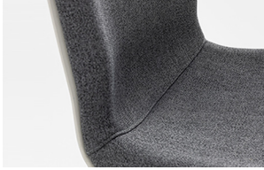
front upholstered shell scocca frontale imbottita