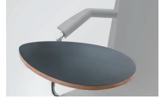
armrest + multilayer tablet bracciolo + tavoletta multistrato