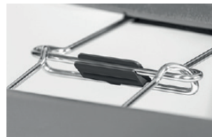
block for alignment links blocco agganci