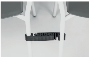
black polypropylene alignment links agganci allineamento in polipropilene nero