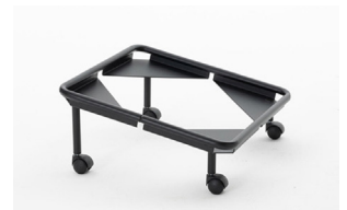
trolley (max 10 pcs) carrello