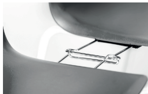
alignment links agganci allineamento