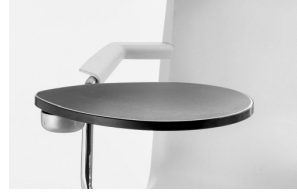
armrest + ABS tablet bracciolo + tavoletta ABS