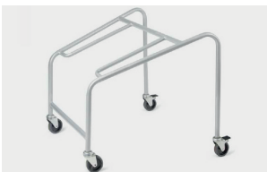
trolley (max 20 pcs) carrello