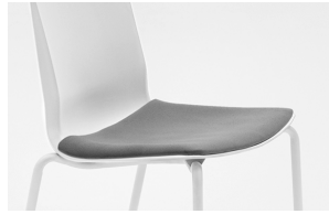
front upholstered sit seduta frontale imbottita