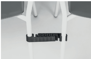
black polypropylene alignment links agganci allineamento in polipropilene nero