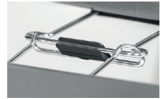
block for alignment links blocco agganci