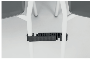
black polypropylene alignment links agganci allineamento in polipropilene nero