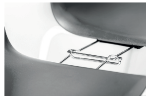
alignment links (not suitable for chair with 2 armrest and writing tablet) agganci allineamento (non utilizzabili per sedia con 2 braccioli e tavoletta)